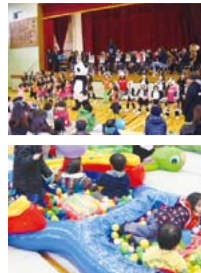
第8回ねりま子育てメッセ(2015/3/7開催)の様子

■ ねりま子育てネットワーク ☎090-3061-3815 E-mail: webmaster@nerima-kosodate.net HPアドレス: http://nerima-kosodate.net/