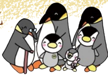
東京都民生委員・児童委員 イメージキャラクター ミンジ