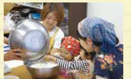
お友達とお菓子づくりに夢中です!

近所に住んでいて、こういう場所があることは知りませんでした。今日は障害のある方も一緒にデザートづくりをしてみました。娘が何かを学んでいるような眼差しで体験していたのが印象的でした。平日の親子向けのイベント等にはなかなか参加できないので、こうした身近な場所で昔遊びなども教えてもらえるような機会が増えればもっと良いですね。