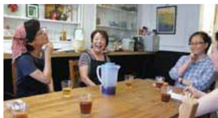
(左上)日替わりのお惣菜は100円(右上)お惣菜を渡しながら日々様子も伺います(下)何気ないおしゃべりも、ちょっとした相談も気軽にできます

「惣菜販売・コミュニティカフェ」。少し聞き慣れない名前ですが、単なるお惣菜の販売ではなく、「食」を通じたコミュニケーションから健康や生活の困りごとのヒントになる情報も教えてくれる場所です。お惣菜は栄養学のプロがつくった体にも優しい味で、カフェスペースでも頂けます。ひと休みしたい方、おしゃべりを楽しみたい方もおすすめです。