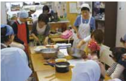
(左上)料理教室で作ったトウヨーグルトケーキ(右上)明るく元気なスタッフのみなさん(下)できることに合わせて、みんなで作業をします

おちゃ福のスタッフは介護のお仕事の経験から介護施設でも自宅でもない、安らげる「居場所」をまちにつくりたいという熱い想いで「ひろば」を開設し、講座やイベント、お食事会なども企画しています。企画の終了後も、参加者は学んだことや体験したことを種に話の花を咲かせて、時にはちょっとしたお悩みのアドバイスをもらうこともあるそうです。