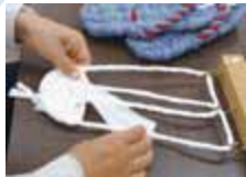
ひとつひとつ丁寧な手仕事で作られています