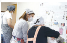
▲作業メンバーとスタッフが 力を合わせて作っています

素朴な姿からは想像もできないほど、ふわふわで自然な甘さの生地に濃厚な生クリームがこぼれ落ちそうな位たっぷり！2つの味が楽しめるロールケーキは完全手作りの限定品です。手を動かして生クリームを懸命に泡立てていた作業所の皆さんは、「美味しい」という言葉がなにより励みになっているそうです。お土産にぜひいかが？