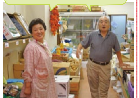
おとり様商店会の小川会長と奥様