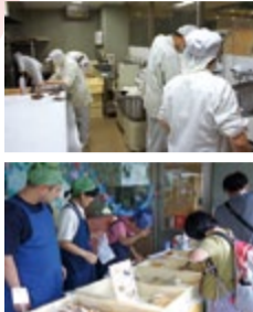
月・金の午後2~3時には施設前での直売も

やすらぎの杜 運営：社会福祉法人 章佑会 練馬区関町北5-7-10 ☎ 03-3928-3315 FAX 03-3928-3310 HP: http://www.yasuragi-mori.com *お問い合わせは、 パン工房まで。 受付時間：9:00~17:00