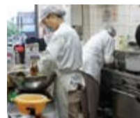
丁寧に磨かれたキッチン はいつもピカピカ

地元の農家の野菜を使い、おかずは全て手作り。お年寄りも食べやすい薄味です。障害のあるスタッフも野菜を切ったり簡単な調理の下ごしらえを行います。お客さまから「美味しかった」と言われることが一番のやりがいです！