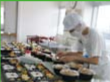
テキパキ手早く盛りつけ