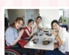
満足顔のねりま編集メンバー。大学生のFさんとMさんは、学生ならではのランチ事情も。

みんなさんお昼はどうしてます？ S 私はお弁当作ってます。 K 私はよく売店であかねの会のお弁当買ってますよ。 F 忙しい時はコンビニですね。 M うちが父がお弁当作るんです。全員え！すごい。いいお父さん。さっさと早くいただきますよ！ 全員いただきます！ S どっちも季節感がありますね。 M あかねの会は薄味で優しい味。F 手づくり感ありますよね。 K やまびこのお弁当はいろいろなおかずが少ずつ入って、女の人にはこういう感じが好きですよ。 S 彩りがきれい。 M 自分で作ると茶色のお弁当になっちゃって。 S なるなる！同系色。(笑)