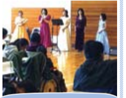
予約はいりません。当日会場にお越しください。

問合せ先 NPO 法人音楽工房のあ ☎ 03-5241-1237 E-mail artnoah@jt3.so-net.ne.jp