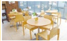
(上) 種類豊富な菓子パンも。 (下) 明るいカフェスペース