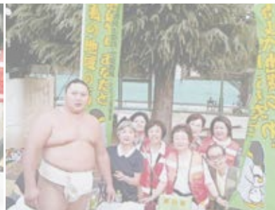
▲イベントでの福祉募金活動(旭丘・小竹・羽沢地区の様子)