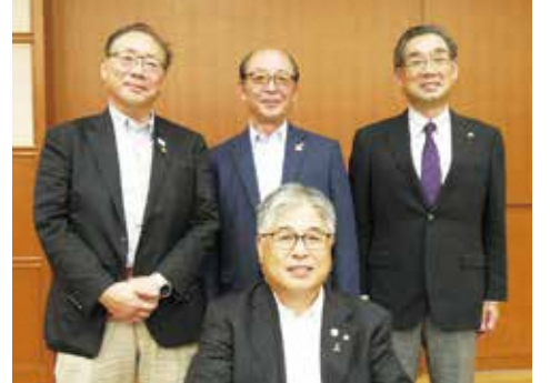
▲インタビューに応じてくださった代表会長と代表副会長のみなさん

ほとんどの方が、本職のかたわら委員の活動をしています。気になる人がいれば様子を見に行ったり、困っている人の相談に乗って、必要な支援が受けられるよう、専門機関へつないだりしています。民生・児童委員には守秘義務があるので、家族のこと、近所のことでも安心して相談することができます。