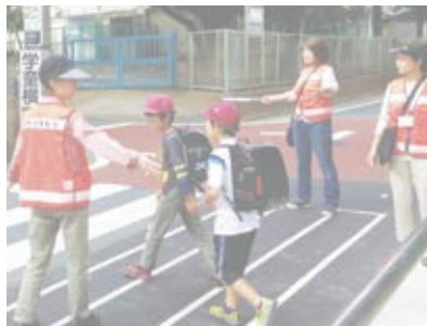
▲小学生の見回り活動(上石神井地区の様子)