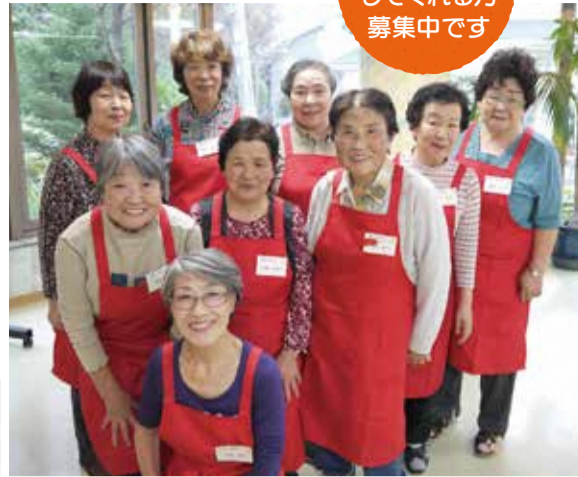
▲ 周囲からの思いやりの心に感謝していると話してくれたボランティアの皆さん。

ランティアの方々が、入居者が気軽に来れるような場を提供 したいという思いでこの「喫茶陽だまり」を立ち上げました。 8テーブルもある広い店内では、地域の方々や入居者の皆さんが、 お茶やお菓子を楽しみながら、会話に花を咲かせています。 ふらっと気軽に立ち寄り、心の安らぎを持てるような 喫茶店。第1土曜日は、美味しいと評判の コーヒーを無料サービス中です。