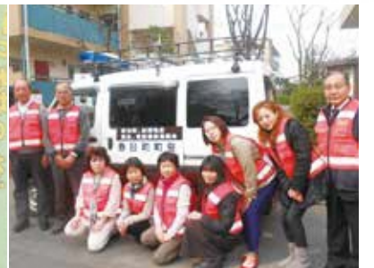
▲熱中症予防の注意喚起パトロール(春日町・田柄地区の様子)