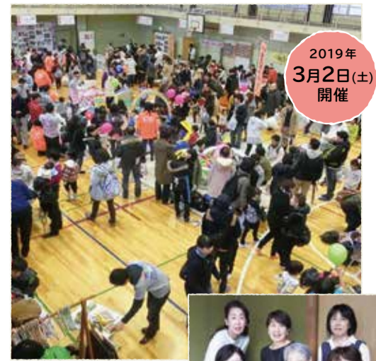
ねりま子育てメッセの様子

2005年、練馬区内の支援団体や子育てに関心のある方々で立ち上げた「ねりま子育てネットワーク」。出産後、行動範囲や友達関係が変化し地域との関わりも増え、出産前とは全く違う生活に戸惑う新米パパやママは多い。そんな時に、子育ての仲間も支援者も近くにたくさんいるというメッセージを伝え、横のつながりを大切にする「孤立しない子育て」を応援する活動を「ねりま子育てネットワーク」は行っています。また、「ねりこそ@なび班」のママたちが制作しているホームページ「ねりこそ@なび」は妊娠・出産、あそび場、イベント、幼稚園情報、保活情報、お悩み、読み物など、子育てに関するタイムリーな情報がママの視点で書かれており、年間26万アクセスもある人気ポータルサイトです。イベントも開催していて、毎年大盛況の「ねりま子育てメッセ」は3月2日(土)に開催決定。子ども服やおもちゃの交換会「リユース・カフェ」が特に人気です。