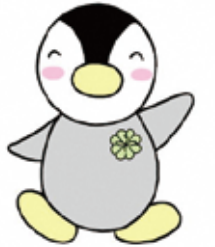
東京都民生委員・児童委員イメージキャラクター「ミンジ」