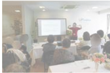
▲ 昨年6月開催、 認知症サポーター養成講座の様子

「江古田しゃべり場カフェ」では、専門家による認知症講座や、大学生ボランティアサークルが企画する催し物、創作活動なども行われ、多世代交流の場としても親しまれています。イベント終了後は館内のリビングで、お茶を飲みながら、お話をする時間を楽しめます。