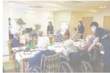
▲ 今年1月開催 書き初めカフェの様子