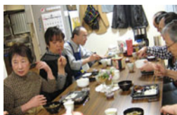
アイデアを出しあいながら、配食のお弁当を試食。