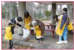
福祉園でのゴミ拾い活動