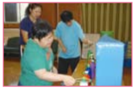
利用者さんの活動の見守り