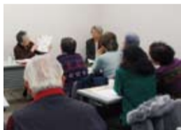
いつも大人気の「身辺整理」講座