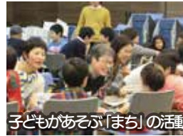
子どもがあそぶ「まち」の活動