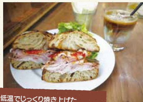
低温でじっくり焼き上げたローストポークをお好みのパンで挟んだサンドイッチ(1140円)。

カフェと保育園の入口が一緒になっており、共有の待合スペースには、子ども達の絵やリサイクル品などが並んでいます。また、ベビーカーや車いすのまま入店することができるようスロープが設置されており、オムツ替えができる多目的トイレもあります。