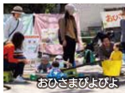
おひさまびよびよ