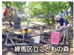
練馬区立こどもの森

練馬区旭町1-16-1 TEL&FAX: 03-3976-3113 月～金曜: 9時～16時 メール: info@asobikkonet.com ホームページ: https://asobikkonet.com