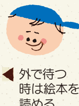
外で待つ時は絵本を読む