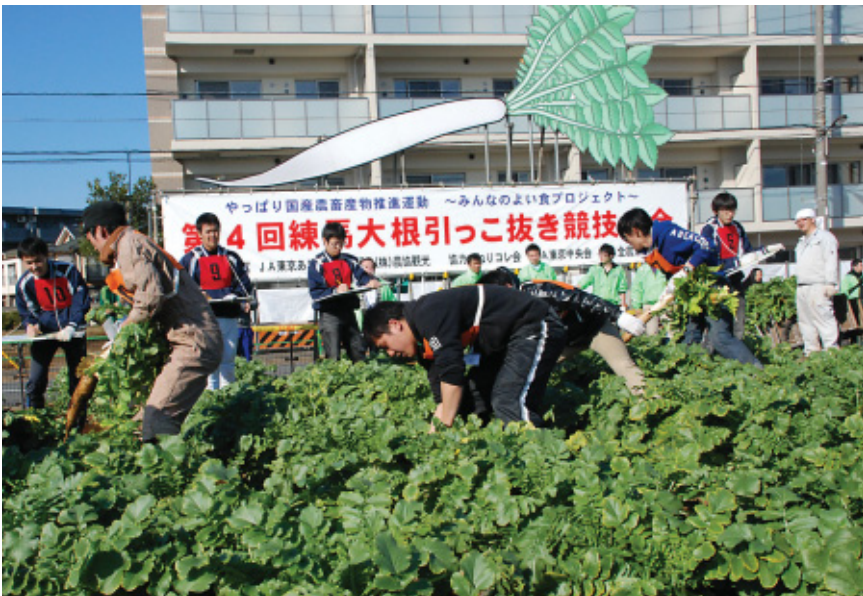
第4回練馬大根引っこ抜き競技大会(平成22年12月5日)