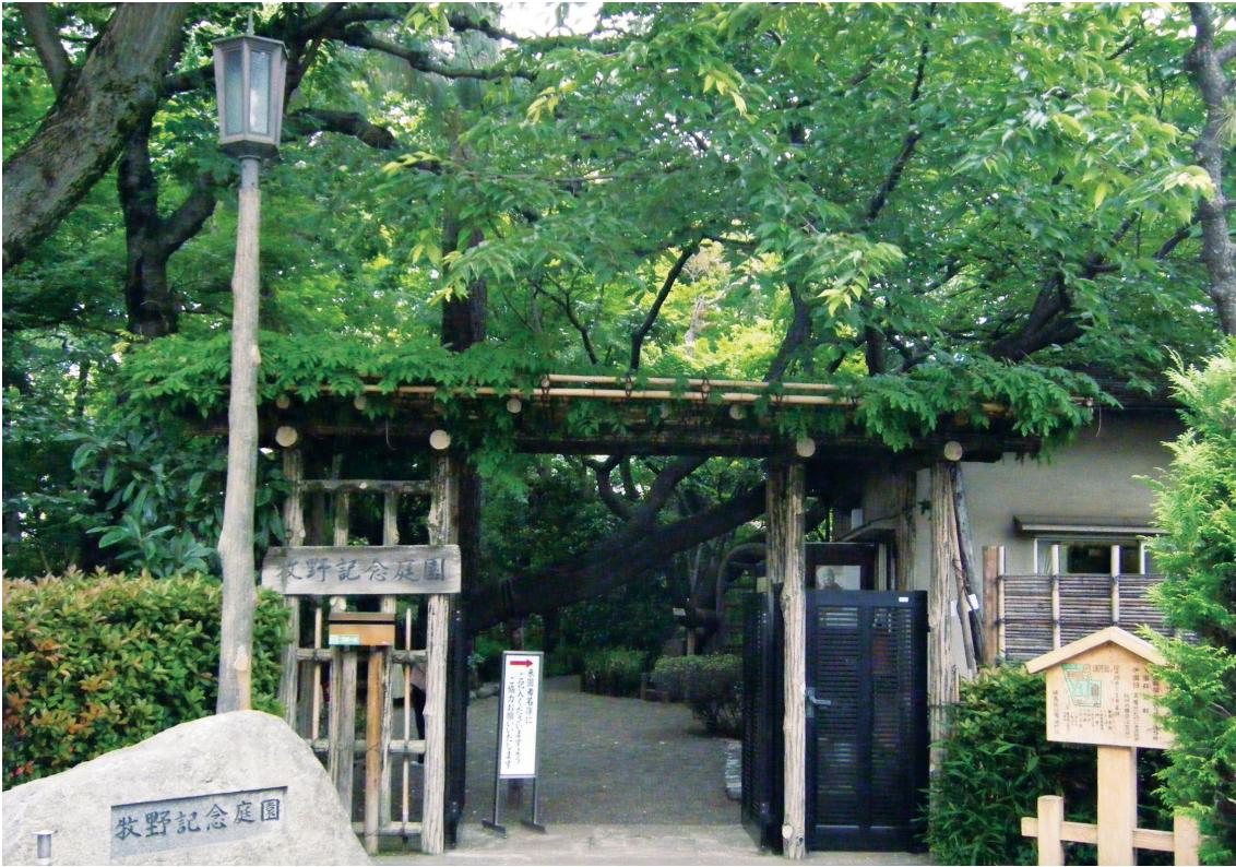
練馬区立 牧野記念庭園 (東大泉6-34-4)

編集・発行 練馬区議会 〒176-8501 練馬区豊玉北六丁目12番1号 電話(3993)1111(代) FAX(3993)2424 http://www.city.nerima.tokyo.jp/gikai/