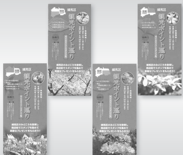
観光ポイント巡り(配布場所: 区民情報ひろば、出張所など)

練馬区議会は、厳しい区の財政状況、民間企業の給与支給状況等を考慮し、今定例会において、練馬区議会議員の報酬および費用弁償に関する条例の一部を改正する条例を可決しました。これにより、4月からの議員報酬が減額となります。