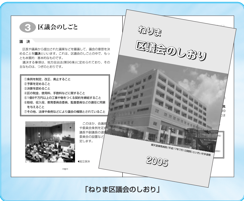
「ねりま区議会のしおり」