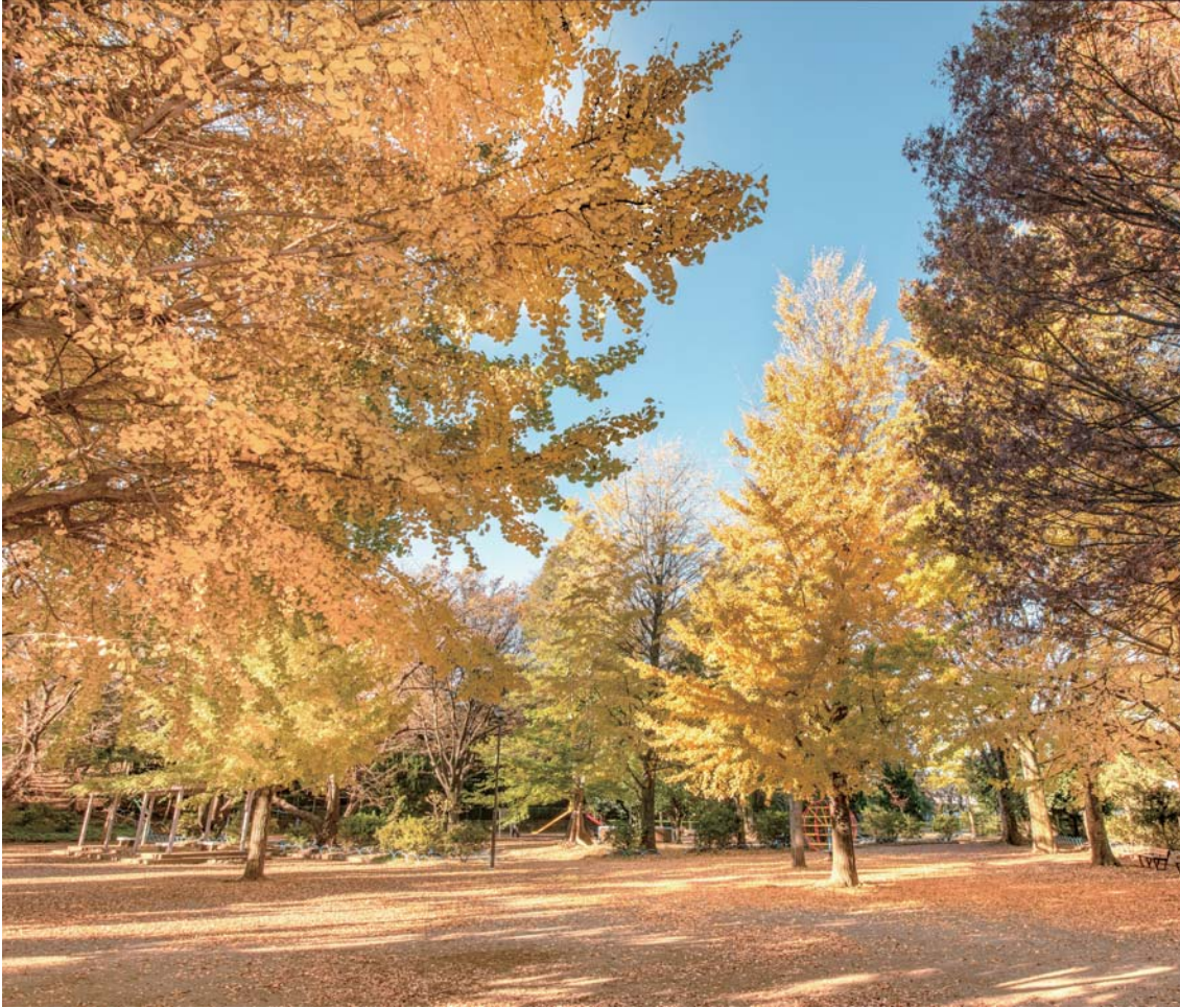
高稲荷公園(桜台6-40-1)の紅葉

令和4年度一般会計補正予算、 練馬区子どもの医療費の助成に関する条例の 一部を改正する条例などを可決