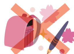
入学祝い・卒業祝い