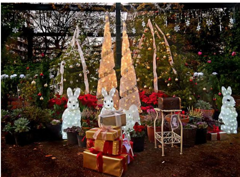
四季の香ローズガーデン イルミネーション