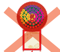
落成式・開店祝いの花輪