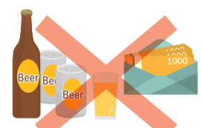
町会の集会や旅行等の催し物への寸志や飲食物の差し入れ