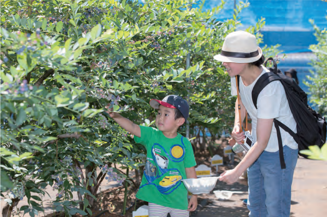
練馬果樹あるファームでブルーベリーの摘み取り

編集・発行 練馬区議会 〒176-8501 練馬区豊玉北六丁目12番1号 電話(3993)1111(代) FAX(3993)2424 http://www.city.nerima.tokyo.jp/gikai/